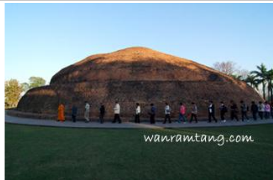
มกุฏพันธเจดีย์ สถูปที่ถวายพระเพลิงพุทธสรีระ

จากนั้นไปกราบไปสักการะ มกุฏพันธเจดีย์ ซึ่งอยู่ห่างออกไปประมาณ 1 กิโลเมตร ไปสักการะสถูปที่ถวายพระเพลิงพุทธสรีระ หลังวันปรินิพพาน 7 วัน กล่าวคำบูชาสถานที่ถวายพระเพลิง และอธิษฐานจิตเรียบร้อยเป็นอันเสร็จพิธี