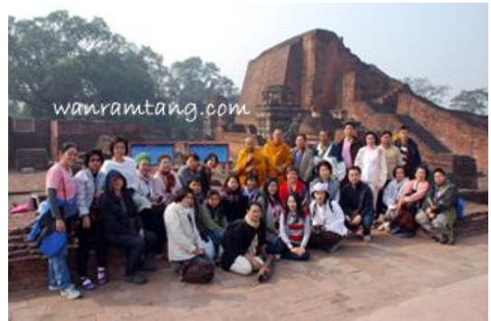
สารีบุตรสถูป มหาวิทยาลัยนาลันทา