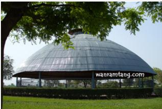
ปาวาลเจดีย์ สารีริกธาตุพระสฤปเจดีย์

ไปกันที่ ปาวาลเจดีย์ สารีริกธาตุพระสฤปเจดีย์ เป็นสฤปโบราณ ขนาดเส้นผ่านศูนย์กลาง 3 เมตร มีสังกะสีมุงเป็นทรงกลมเหมือนกับศาลาแปดเหลี่ยม ล้อมรอบฐานเจดีย์โบราณ ซึ่งได้รับการขุดค้นจากฝ่ายโบราณคดีของรัฐบาลกลางไปแล้ว และนักโบราณคดียืนยันเป็นหนึ่งเดียวว่า ที่นี่คือสฤปที่บรรจุพระบรมสารีริกธาตุ ที่ได้ขอแบ่งจากกุสินาราและจากสฤปอีก 7 แห่ง แล้วอัญเชิญมาบรรจุไว้ในสมัยเดียวกันกับ เมืองราชคฤห์ของพระเจ้าอชาตศัตรู คณะราชาลิจฉวี ราชามัลละ ราชากิลิยะแห่งรามคาม พราหมณ์แห่งเวฐฐีปกันคร ราชามอลินคร ราชาศากยะแห่งกบิลพัสดุ์