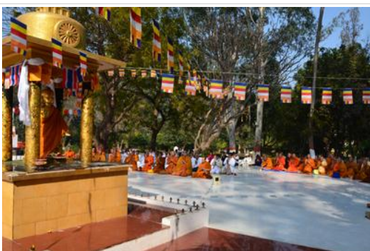
วัดเวฬุวันวิหาร วัดแห่งแรกในพุทธศาสนา

ไปกันที่ สวนเวฬุวัน สักการะบูชาสถานที่อันเคยเป็นที่ตั้งของ วัดเวฬุวันวิหาร วัดที่พระเจ้าพิมพิสารได้ทรงถวายสวนเวฬุวัน ให้เป็นพระอารามหลวงแห่งแรกในพระพุทธศาสนา พระพุทธองค์ทรงประทับจำพรรษา ณ ที่แห่งนี้รวมแล้ว 6 พรรษา เป็นที่ทรงตั้งอัครสาวกคือ พระโมคคัลลานะ พระสารีบุตร และยังเป็นสถานที่ที่พระอรหันต์ 1,250 รูป มาชุมนุมกันโดยมิได้นัดหมาย ในวัน จาตุรงคสันนิบาต มาชุมนุม และพระพุทธองค์ได้ทรงแสดงโอวาทปาติโมกข์ แก่ภิกษุเหล่านั้น