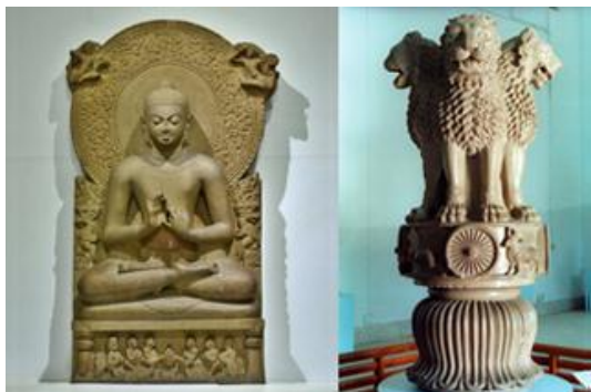
พิพิธภัณฑ์สารนาถ