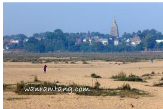
ริมฝั่งน้ำเนรัญชรา ที่เหลือแต่ฝืนทราย