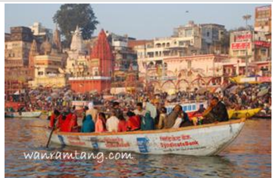
ล่องเรือแม่น้ำคงคา - พาราณสี