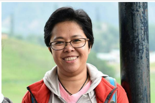
ปลา' Tour Leader พาเที่ยว

08.45 น. ถึงแผ่นดินอินเดียท่าอากาศยานนานาชาติ เมืองพาราณสี รถบัสมารับ เดินทางเข้าสู่ที่พัก