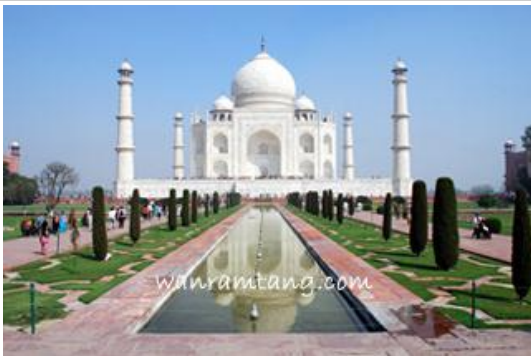
ทัชมาฮาล Tajmahal - อัครา

จากนั้นไปเที่ยวต่อกันที่ ป้อมปราการ อัครา (Agra Fort) พระราชวังที่ยิ่งใหญ่ ที่กษัตริย์แห่งราชวงศ์โมกุลใช้เป็น พระราชวังสืบต่อมาหลายรัชกาล ทั้งยังเป็นอนุสรณ์แห่งความหลังและลมหายใจสุดท้ายที่นาเศร่า ของเจ้าชายชาห์จาฮาน