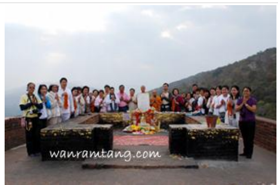
มุลคันธกุฎี ณ ยอดเขาคิชฌกูฏ