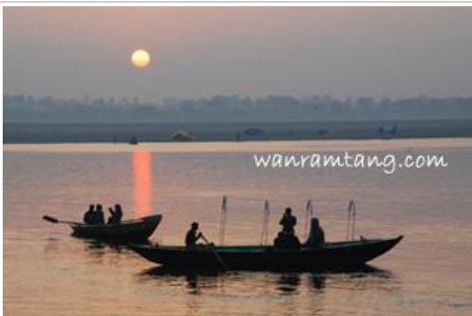
อาทิตย์ขึ้น ณ ฝั่งแม่น้ำคงคา - พาราณสี

05.00 น. ออกจากที่พัก ตั้งแต่ฟ้ายังไม่สว่างไปเยือน คงคามหานที ลงเรือล่องไปตามลำน้ำคงคา ชมวิถีชีวิตผู้คนริมฝั่งน้ำ ดูพิธีอาบน้ำล้างบาป บูชาพระอาทิตย์ ชมกองไฟศักดิ์สิทธิ์ที่ไม่เคยดับบริเวณท่ามณิกรณิการ์ เพราะมีการเผาศพอยู่ตลอดเวลาตามความเชื่อที่ว่าที่นี่เป็นท่าของพระศิวะ หากนำศพมาเผาและเอากระดูกเข้าถ่านโปรยลงที่ท่าแห่งนี้จะได้ไปสวรรค์ ทำพิธีลอยกระทงดอกไม้และจุดเทียนบูชา พระบรมสารีริกธาตุ และ แม่คงคา ชมพระอาทิตย์ขึ้นริมฝั่งคงคาซึ่งเรียกได้ว่างดงามที่สุดแห่งหนึ่งในโลก