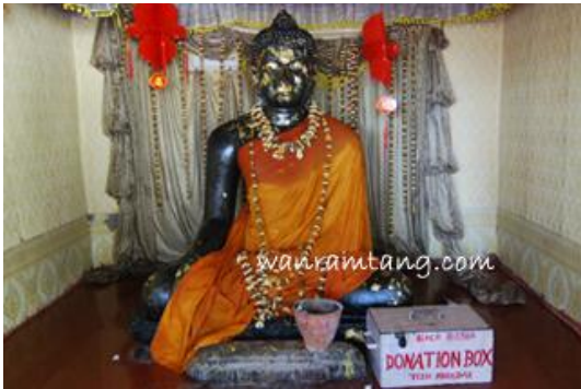
หลวงพ่อดำ เมืองนาลันทา

สักการะ สารีบุตรสถูป เป็นสถูปที่สร้างเพื่อเป็นอนุสรณ์แก่พระสารีบุตร อัครสาวก บริเวณที่ประชุมเพลิง สร้างสมัยแรกโดยโยมมารดาท่านสารีบุตร คือ นางสารีพราหมณี ต่อมาพระเจ้าอโศกได้สร้างเสริมจากที่เดิม และกลายเป็น สถานที่สักการะของมหาชน ตั้งอยู่ภายในมหาวิทยาลัยนาลันทา