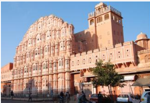
วังสายลม Hawa Palace - ชัยปุระ

นครชัยปุระ (Jaipur) นครแห่งชัยชนะ หรือ “นครสีชมพู” ชัยปุระเป็นเมืองหลวงของรัฐราชสถาน ซึ่งได้รับการออกแบบวางผังเมืองอย่างสวยงาม เป็นเมืองที่สร้างขึ้นใหม่โดยท่านมหาราชา ไสว ชัย สิงห์ ที่ 2 เป็นชุมชนศิลปะปั้นและช่างฝีมือ มีชื่อเสียงด้านการผลิตสินค้าหัตถกรรมหลากหลายชนิด ชัยปุระได้รับสมญานาม “นครสีชมพู” (Pink City) เพราะเมืองถูกทาสีชมพูเพื่อต้อนรับการเสด็จเยือนของ Prince of Wales ซึ่งต่อมาคือ King Edward VII แห่งสหราชอาณาจักร