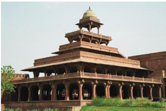
ฟาเตห์ปุร์ สิครี