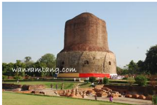
อัมเมกขสถูป สถานที่แสดงปฐมเทศนา