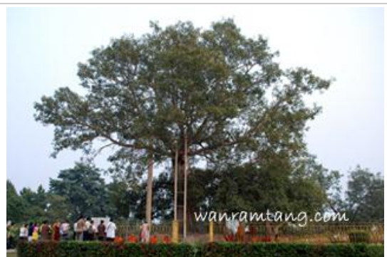
ต้นอานันทโพธิ์ ภายในเขตวันมหาวิหาร

เริ่มต้นด้วยการไปที่ เขตวันมหาวิหาร พระอารามนี้ท่านอนาถบิณฑิกะคุหบดี เป็นผู้หาสถานที่เพื่อจะสร้างวัดถวายพระพุทธเจ้า เห็นสวนเจ้าเขตกุมาร เหมาะกว่าที่อื่นๆ ท่านจึงได้เจรจาขอซื้อสวนนี้ เจ้าเขตได้เสนอราคาที่ดินโดยการให้นำทองคำมาปูเรียงจนเต็มบริเวณที่ต้องการซื้อทั้งหมด ท่านจึงให้คนนำเหรียญนบรทุกแผ่นทองคำมาเรียงจนเกือบเต็มบริเวณนั้นทั้งหมด เจ้าเขตเห็นถึงศรัทธาที่แน่วแน่ของท่าน ประสงค์ร่วมทำบุญด้วยจึงมอบที่เหลือนั้นให้ และขอให้สร้างซุ้มประตูไว้ด้วย เมื่อสร้างวัดเสร็จแล้วท่าน อนาถะได้จารึกชื่อเจ้าเขตไว้ที่ซุ้มประตูอันเป็นที่มาของชื่อวัดว่า เขตวันมหาวิหาร ท่านอนาถบิณฑิกะเศรษฐี ได้สร้างวิหาร กุฎี ห้องประชุม โรงครัว เวลกุฎี ห้องน้ำ บ่อน้ำ เป็นต้น พระพุทธองค์เสด็จประทับจำพรรษา ณ พระเขตวันแห่งนี้ รวมแล้วถึง 19 พรรษา