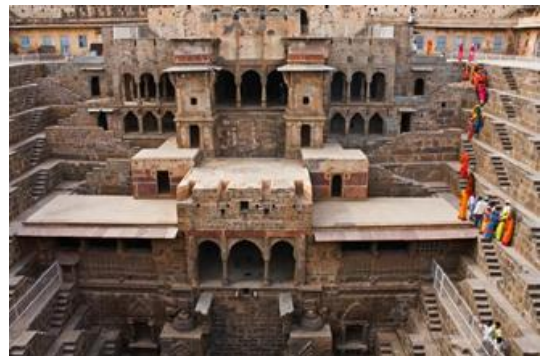
Chand Baori บ่อน้ำขั้นบันไดโบราณ

เที่ยง กินอาหารกลางวัน แล้วออกเดินทางสู่เมืองชัยปุระ * ระยะทาง 250 กิโลเมตร ใช้เวลาเดินทาง 5-6 ชั่วโมง