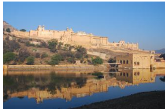
ป้อมปราการแอมเบอร์ Amber Fort - ชัยปุระ

เริ่มต้นด้วย ไปถ่ายรูปที่ พระราชวังสายลม (Palace of the Wind) *ไปถ่ายรูปตอนเช้า รูปสวย แสงสวย เขตวังเดิมที่ปัจจุบันตั้งอยู่ในย่านใจกลางเมือง จุดที่จะชมพระราชวังนี้ได้ดีที่สุดในตอนเช้า ต้องข้ามถนนไปยืนชมและถ่ายรูปจากฝั่งตรงข้าม