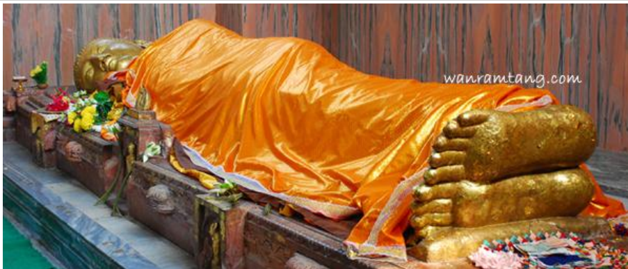
องค์พระพุทธรูปปรินิพพาน

- หากจะทำพิธีถวายผ้าห่มพระพุทธรูปปรินิพพานให้เตรียมผ้าขนาด กว้าง 2 เมตร ยาว 5.50 เมตร จะห่มได้พอดี สวดมนต์บูชา องค์พระพุทธรูปปรินิพพาน และถวายเครื่องสักการะ ปิดทองที่พระพุทธรูปบาท และอธิษฐานจิตขอพร