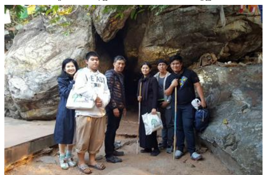
ถ้ำพระโมคคัลลานะ บนเขาคิชฌกูฏ