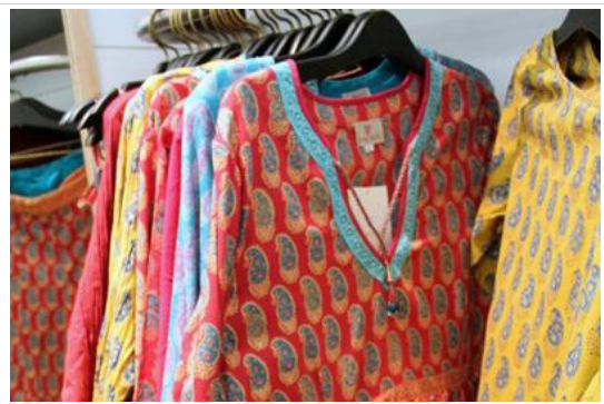
Shopping ชื่อของฝากกลับบ้าน

เย็นถึงค่ำ- กลับมา กินอาหารค่ำ ที่โรงแรม