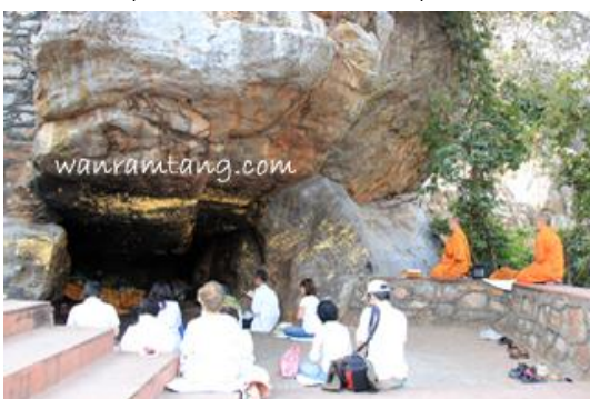
ถ้ำสุกรชาตา บนเขาคิชฌกูฏ