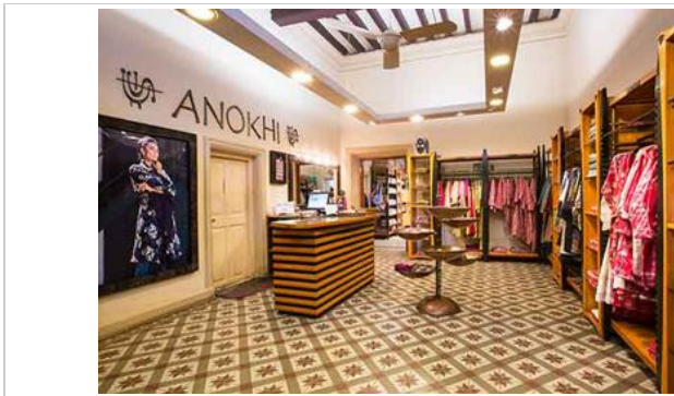
ร้าน Anokhi Shop

แล้วไป ช้อปปิ้ง ให้น่าใจ เท่าที่เวลาอำนวย Highlight พาไปร้านเสื้อผ้าชื่อดัง ร้าน ANOKHI จำหน่ายเสื้อผ้าสไตล์อินเดีย ผ้าฝ้ายแท้ 100% พิมพ์ลายเก๋ๆด้วยงาน Printed Block อันซีนชื่อของเมืองชัยปุระ