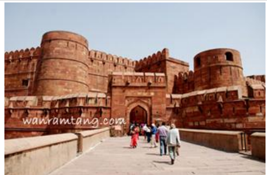
อัครา ฟอรัท Agra Fort - อัครา