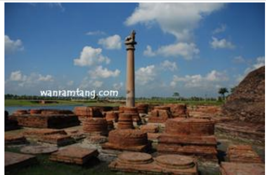
เสาหินพระเจ้าอโศก สฤปกุฎาคารศาลापामหาวัน

ไปต่อกันที่ กุฎาคารศาลापामหาวัน เมื่อพระพุทธองค์ทรงแสดงวิธีให้โรคร้ายระงับได้แล้ว ชาวเมืองไวสาลีประสงค์สร้างอารามถวาย พระพุทธองค์ก็โปรดให้สร้างพระอาราม นอกเมืองเวสาลี ในปามหาวัน ทางเหนือของอาณาจักรวัชชี อารามที่ชาวลิจฉวีสร้างถวายพระพุทธองค์ในปามหาวัน เรียกว่า "กุฎาคาร" มีภิกษุเข้าอยู่จำพรรษาในอารามนี้เป็นประจำสำหรับพระพุทธองค์นั้นประทับอยู่ในพรรษาที่ 5 และ พรรษาสุดท้ายคราวเมื่อเสด็จไปกุสินารา