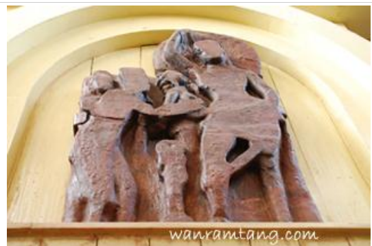
ศิลปะสลักภาพพุทธประวัติปางประสูติ

เพล- กินอาหารกลางวัน ที่วัดไทยนรราชรัตนาราม (วัดไทย 960)