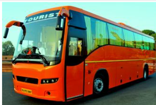
รถปรับอากาศ สำหรับคณะนี้